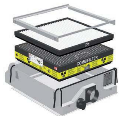
MAO-6HC combinaison charbon actif