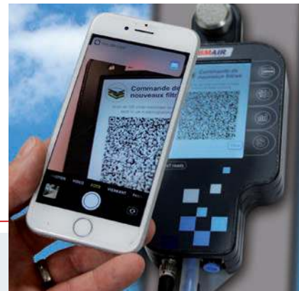
Commande facile de filtres

Large possibilités de données grâce à la connexion numérique Rx / Tx