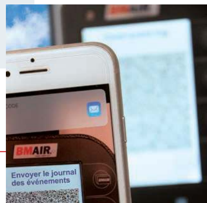
Transfert des informations du système et des événements