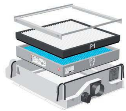
MAO-6HC combinaison amiante